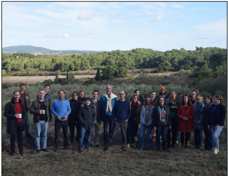
Membres du projet au Séminaire de lancement de novembre 2022

Auteurs : Lorenzo Carré, Ronan le Velly Conception graphique : Atelier Labotte