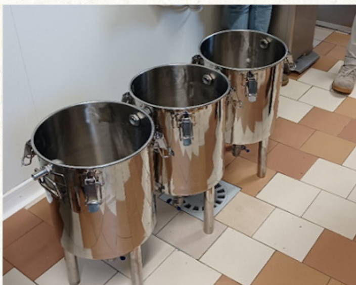
Système de décantation en inox (3 x 30L)

Attention: de part sa composition en acides gras et l'équilibre entre oméga 6/3, l'huile de chanvre est très instable et sensible à l'oxydation et à la chaleur. Il faut donc porter une vigilance accrue aux conditions de stockage, transport et conditionnement.