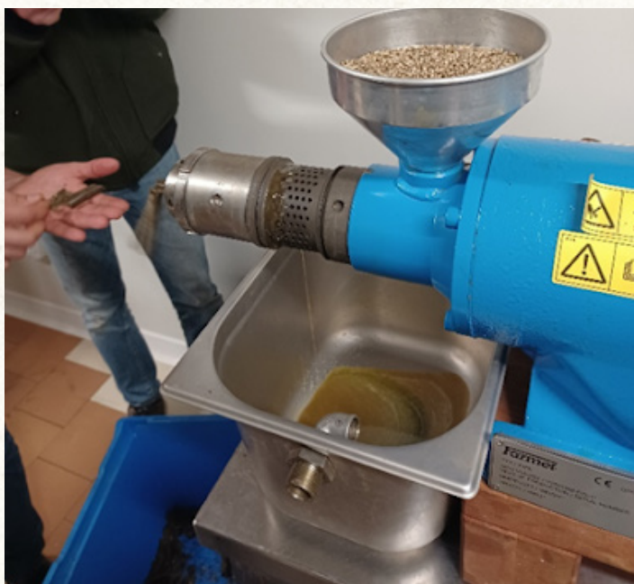
Presse axiale utilisée pour le pressage d'huile de chanvre à la ferme

Le décortiquage nécessite d'être équipé d'une décortiqueuse à impact.